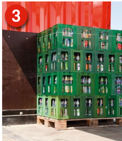
3 Ladung: Palettierte Getränkekästen immer bündig an die Stirnwand laden. Halten Sie stets den Lastverteilungsplan ein.