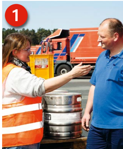
1 Erster Schritt: Vor dem Verladen palettierter Getränkekästen darauf achten, dass diese möglichst homogen und gleich hoch gepackt werden.

■ Getränkeladungen, die nicht mit Aufbauten gemäß der DIN EN 12642 Code XL transportiert werden (siehe VDI 2700 Blatt 12 Abschnitt 2.1) oder nach den Ladungssicherungsmaßnahmen in Abschnitt 4.3.2 gesichert sind, sollten nach der Richtlinie VDI 3968 zu einer Ladeeinheit zusammengefasst und gesichert werden.