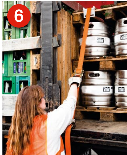
6 Zurren: Trotz des zertifizierten Auflegers (DIN EN 12642 Code XL für Getränke) muss die gestapelte Palettenladung niedergezurrt werden.