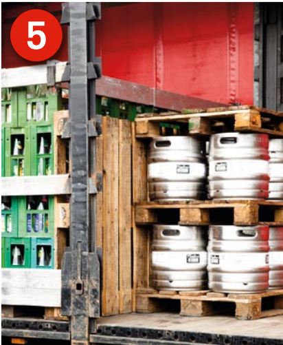
5 Unterschiedliche Ware: Die Ladung ist auf dem Trailer. Achten Sie darauf, dass auch die oberen Fässer vollständig auf eigenen Paletten stehen.