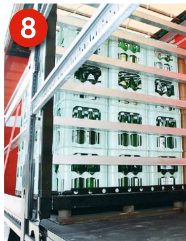
8 Weitere Lasi-Variante: Kipplatten sowie Sperrbalken, die mittels Lochschiene mit dem Fahrzeugaufbau verbunden sind.