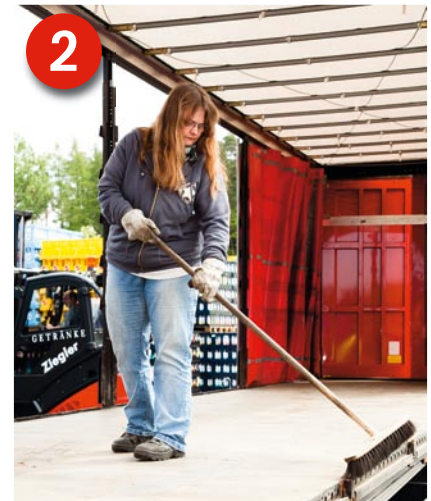
2 Voraussetzung: Sie müssen über ein geeignetes Fahrzeug (DIN EN 12642 Code XL für Getränke) verfügen und die Ladefläche besenrein säubern.