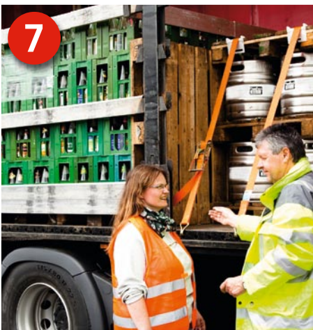
7 Geschafft: Die Ladung ist richtig geladen und gesichert, so dass die Plane geschlossen werden kann und das Fahrzeug abfahrbereit ist.