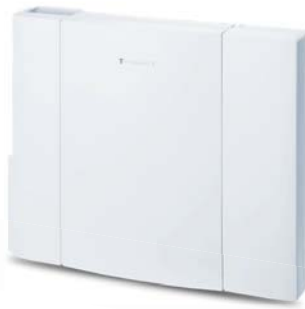
Octopus F X1